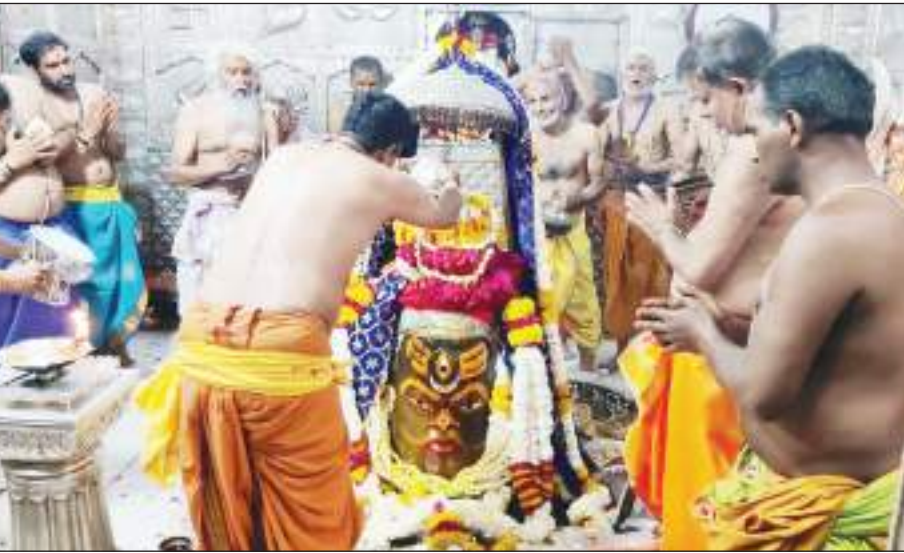
बाबा महाकाल को एक लोटा केसरयुक्त रंग का जल अर्पित कर प्रतीकात्मक रूप से मनाया गया रांपचमी का पर्व।

8 ऑल इंडिया इंटर यूनिवर्सिटी क्रिकेट (पुरुष) चैंपियनशिप के उद्घाटन पर हुआ पहला मुकाबला